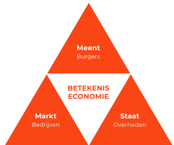
Figuur 2. Markt, staat en meent

Klomp en Oosterwaal (2021, THRIVE, Fundamentals for a new economy)