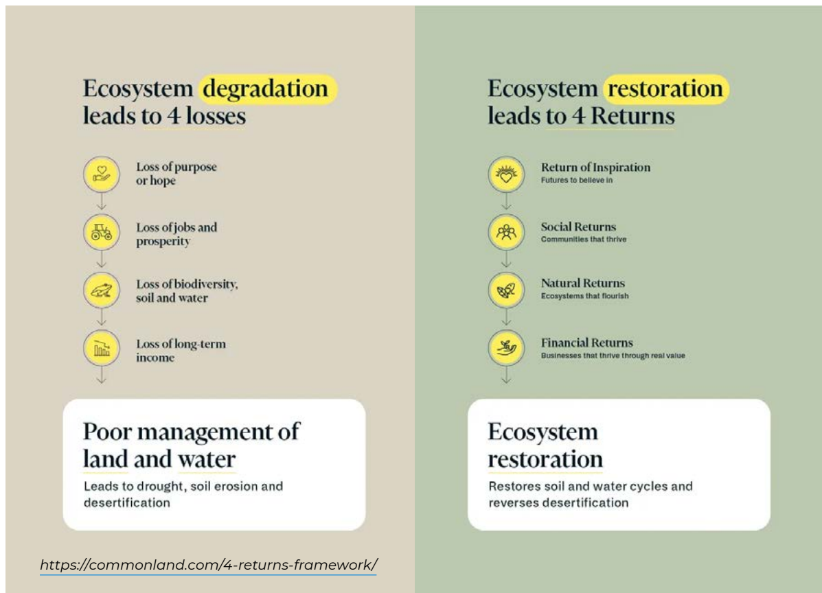
Figuur 3. 4 Returns Framework

Daarbij is het cruciaal te durven vertrouwen op een lange termijnagenda en niet te rekenen op quick wins .